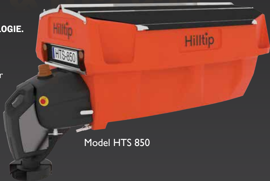
Model HTS 850

Zusätzlich zu dem Polyethylen-Streugutbehälter bietet dieses einzigartige All-in-One Design integrierte Tanks für das optionale Vorbefeuchtungssystem.